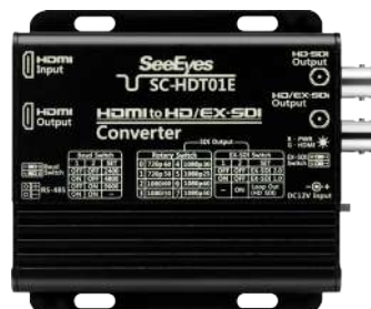
[ SC-HDT01E ]