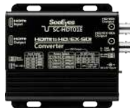
[ SC-HDT01E ]