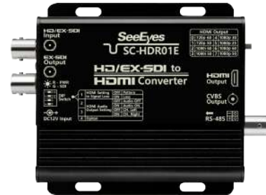
[ SC-HDR01E ]